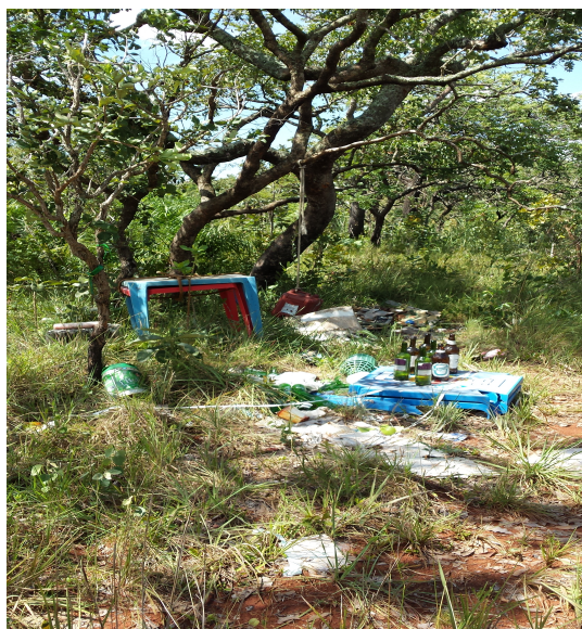
Figura 3: Exemplo de desrespeito com o meio ambiente: restos de festa encontrado na área do Cerrado do "CEU".

Considerando isto, a área de estudo é um fragmento de cerrado em distúrbio, devido à presença de espécies invasoras e o grau de intervenção humana. Apesar da riqueza e potencial de uso da área para estudos e programas de Educação Ambiental, é possível encontrar lixo e entulhos em diversos locais desta (Figura 3); além de não haver controle sobre a entrada de pessoas e atividades que ocorrem na área.