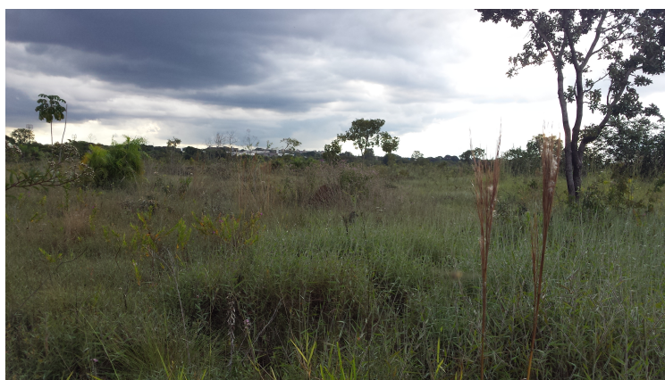
Figura 2: Aspectos gerais do Cerrado do "CO".

Segundo a classificação de Köppen, o clima de Brasília enquadra-se entre os tipos “tropical de savana” e “temperado chuvoso de inverno seco”, distinguindo-se claramente duas estações: verão chuvoso e quente, que vai de outubro a abril; e inverno frio e seco, de maio a