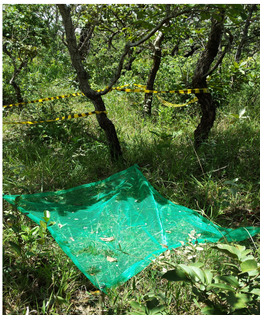
Figura 4: Coletor instalado em área de estudo para análise da chuva de sementes.

A identificação e classificação das sementes e frutos encontrados em cada coletor em espécies arbóreas, arbustivas e herbáceas foi feita através de comparação com material de herbário, literatura botânica ilustrada e com a ajuda de especialistas.