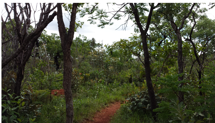
Figura 1: Aspectos gerais do Cerrado da "CEU". Fonte: Carolina Macedo (2015).

O trabalho foi conduzido em um fragmento de Cerrado sensu stricto localizado na APA do Paranoá, no Centro Olímpico (CO) da Universidade de Brasília - UnB em uma área de 110 hectares conhecida como cerradinho do “CO”, entre os vértices de coordenadas 15°46’S e 7°50’O e 15°45’S e 47°51’O. Foram estudadas duas áreas: uma próxima ao alojamento estudantil ou Casa do Estudante Universitário (CEU) e outra próxima ao Lago Paranoá, dentro do Centro Olímpico da UnB (Figuras 1 e 2).