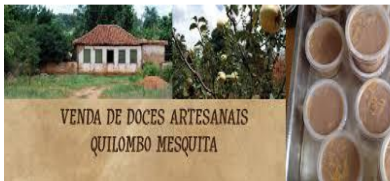
Propaganda para venda da marmelada