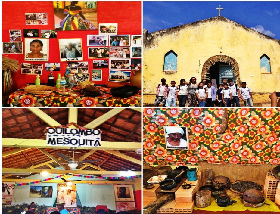
Museu do Quilombo Mesquita FIGURA 4

Encontram-se também manifestações religiosas de matriz africana estas menos aparentes e mimetizadas pelo sincretismo religioso. A tradição da cura é um outro espaço importante para a preservação da cultura e religiosidade do povo remanescente do Quilombo Mesquita, e é nesse espaço que o conhecimento dos africanos, índios e portugueses mais se misturaram.