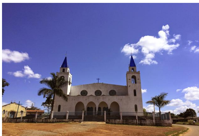
A mesma igreja atualmente