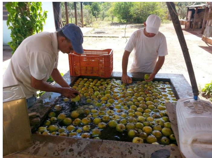
Lavagem e seleção do marmelo