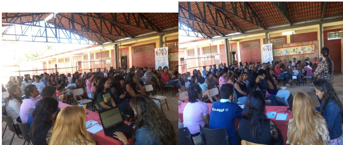
Reuniões e estudos de discussão na construção do PPP – Escola Braga I FONTE: CARVALHO, Fabiana.2015. FIGURA 13

Para a realização dessa pesquisa, á princípio foi realizado um diagnóstico da situação real da comunidade e de toda a vivência escolar na Escola Municipal Braga II. Para realizar o diagnóstico, é necessário fazer algumas perguntas iniciais sobre a comunidade na qual a escola se insere, tais como: Quem somos? Onde estamos? Como vivemos? Há quanto tempo vivemos nessa comunidade? Quem são nossos ancestrais? Quais são os conhecimentos que aprendemos na vivência cotidiana da nossa comunidade?