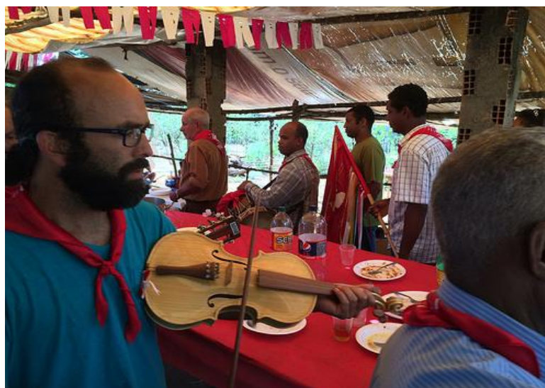
Folia de nossa Senhora da Abadia Fonte: CARVALHO, Fabiana. 2014. FIGURA 3