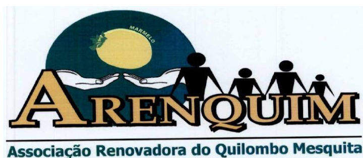
Logo da Associação de moradores do Quilombo Mesquita