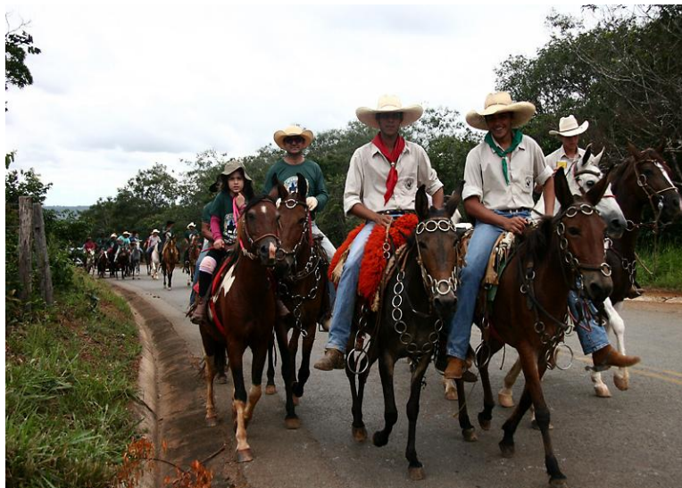
Cavalgada da Festa do Marmelo FIGURA 2

realização de grandes eventos religiosos: a “Folia de São Sebastião” em janeiro, a “Festa do Marmelo” em fevereiro, a “Folia do Divino Espírito Santo” em maio, e a “Folia de Nossa Senhora D’Abadia”, padroeira da comunidade, em agosto.