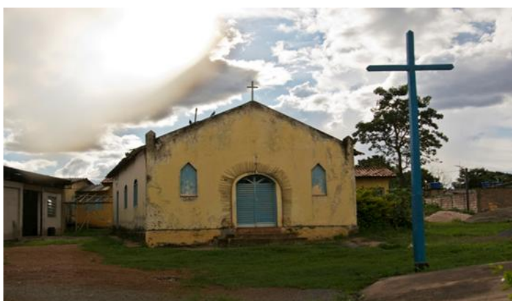
A igreja ainda na antiga construção que serviu como escola