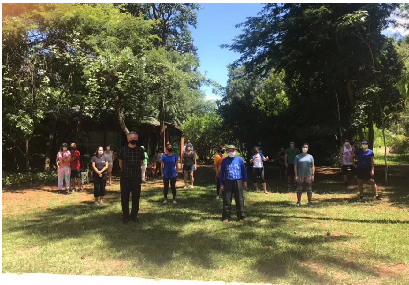
Aulas de Tai Chi Chuan e Jin Shin Jyutsu no Jardim Botânico de Brasília