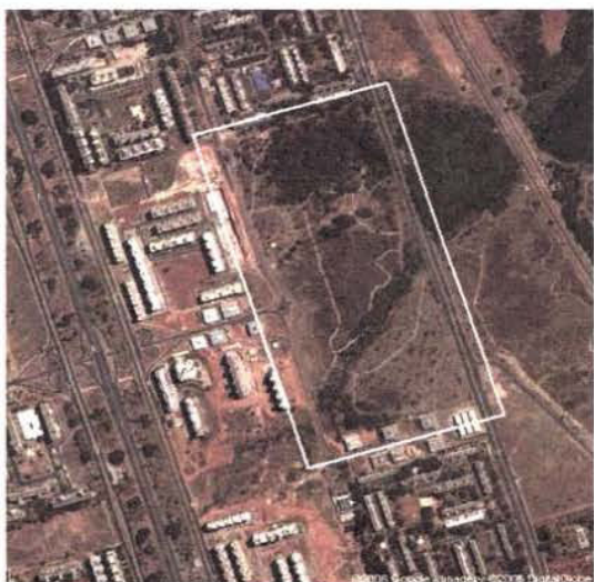
Figura 1 - Vista aérea do Parque Olhos d'Água (retângulo), localizado nas Superquadras Norte (SQN) 412-413, Asa Norte, Brasília/DF, através do programa Google Maps ( http://maps.google.com ).

O Parque de Uso Múltiplo Olhos d'Água ocupa uma área de 21 hectares, estendendo-se ao longo da SQN 413/414 e SCLN 414/415, Brasília, nas coordenadas 15°44'46" S e 47°53'16" W, a uma altitude média de 1050m acima do nível do mar ( Figura 1 ). Sua fundação foi regulamentada pelo Decreto nº 15.900 de 12 de setembro de 1994, estimulada por um grupo de pessoas, intitulado Sociedade dos Amigos do Parque Olhos d'Água (SAPO), que se reuniu para reivindicar a criação de uma unidade de conservação, a fim de preservar os recursos naturais ali existentes. O Parque possui grande importância ecológica, pois é um remanescente do bioma Cerrado, encravado em um dos grandes centros urbanos do país. Apesar de possuir partes muito antropizadas, o Parque ainda apresenta grande potencial biológico, principalmente no que concerne à flora. A vegetação é formada por cerrado sentido restrito, mata mesofítica, mata de galeria e vegetação aquática. Atualmente o Parque é utilizado como uma importante área de lazer e prática de atividades físicas pela população de Brasília.