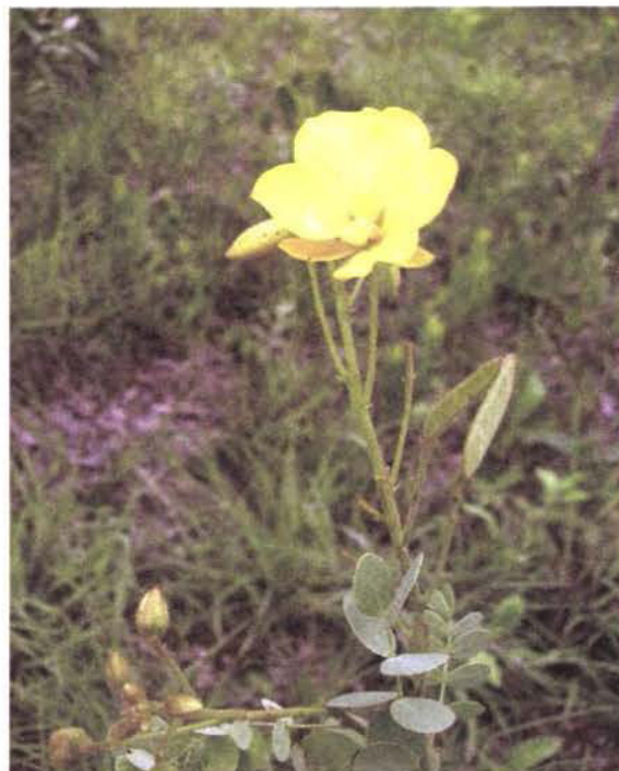
Figura 3 - Chamaecrista benthamiana (Harms) H.S. Irwin & Barneby, espécie encontrada apenas no Parque Olhos d'Água, não listada para nenhuma Unidade de Conservação do Distrito Federal.