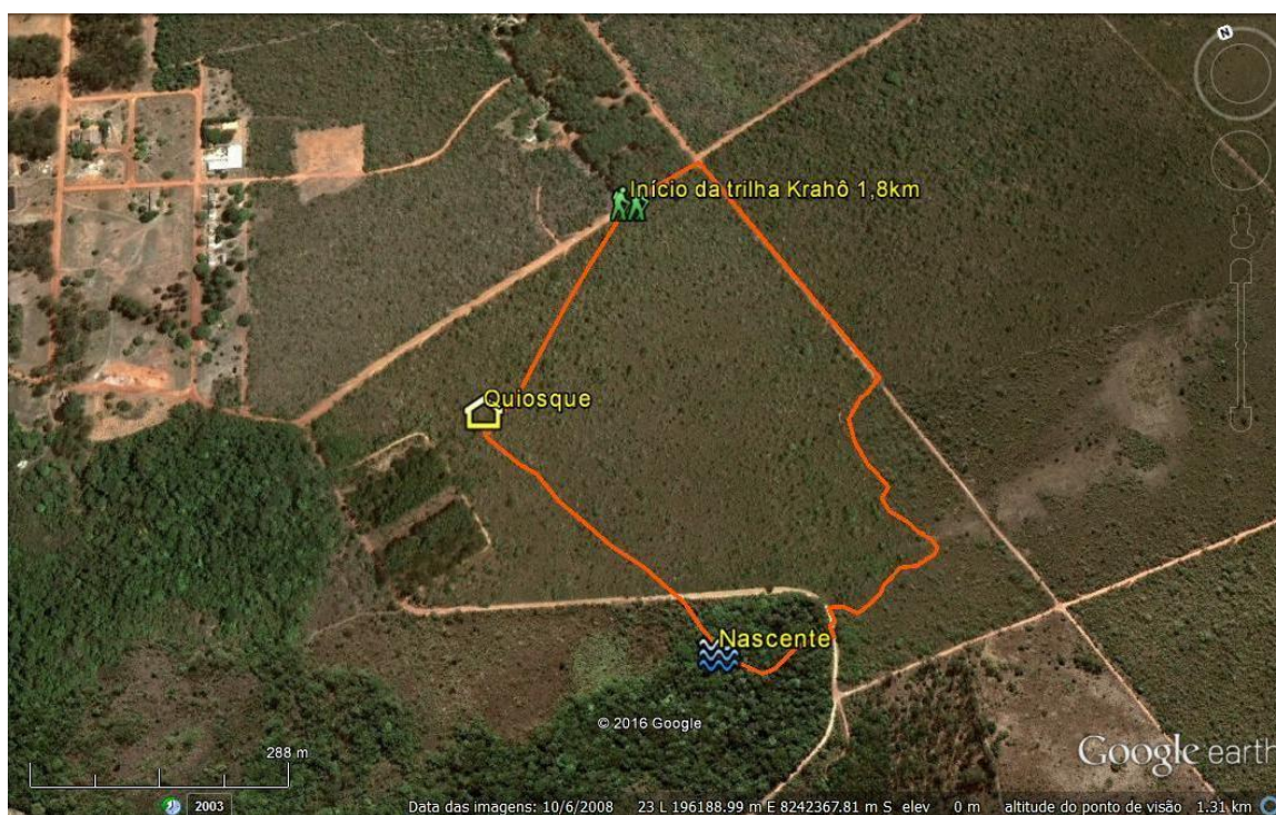
Figura 2. Percurso da trilha.

Universidade de Brasília, como parte da disciplina Projeto Integrador. Para criar sua base de dados, foi feito um reconhecimento da trilha selecionada a fim de delimitar seu percurso (figura 2), de forma que ela incluísse a nascente do Córrego Cabeça de Veado e evidenciasse fitofisionomias distintas do Cerrado ao longo de seu caminho. O trecho escolhido foi então percorrido inúmeras vezes visando à seleção de pontos e coleta de potenciais informações pertinentes ao aplicativo.