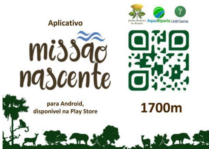
Figura 3. Modelo gráfico das placas do aplicativo Missão Nascente.

Por fim, o desenho das placas foi criado de modo minimalista para evitar a poluição visual da trilha, conforme figura 3.