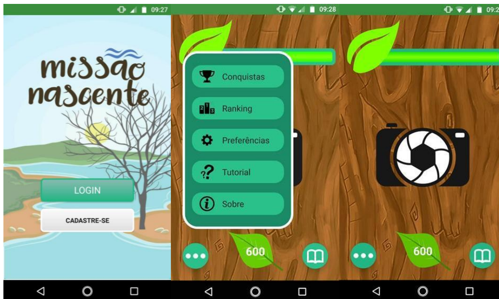
Figura 4. Interface do aplicativo Missão Nascente.

melhores colocados e troféus de conquistas. Como característica única, permite também que o usuário coleccione fotos pessoais tiradas durante a trilha, personalizando o uso do aplicativo.